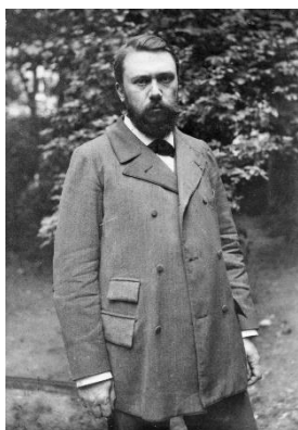
anonyme Gustave Geffroy (1855-1926)

La reproduction du visuel appartenant aux collections du musée Clemenceau est autorisée à titre gracieux uniquement dans le cadre de l'illustration d'articles concernant l'exposition et pendant sa durée.