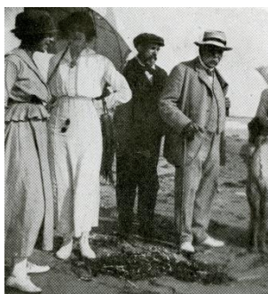
Gustave Geffroy et Georges Clemenceau en Vendée 1916